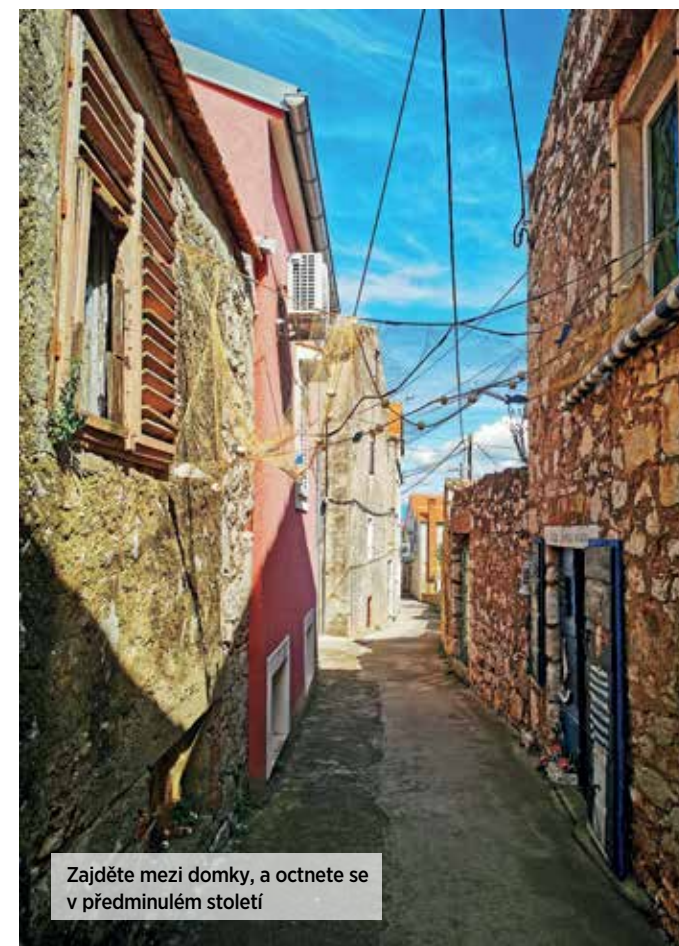
Zajděte mezi domky, a octnete se v předminulém století