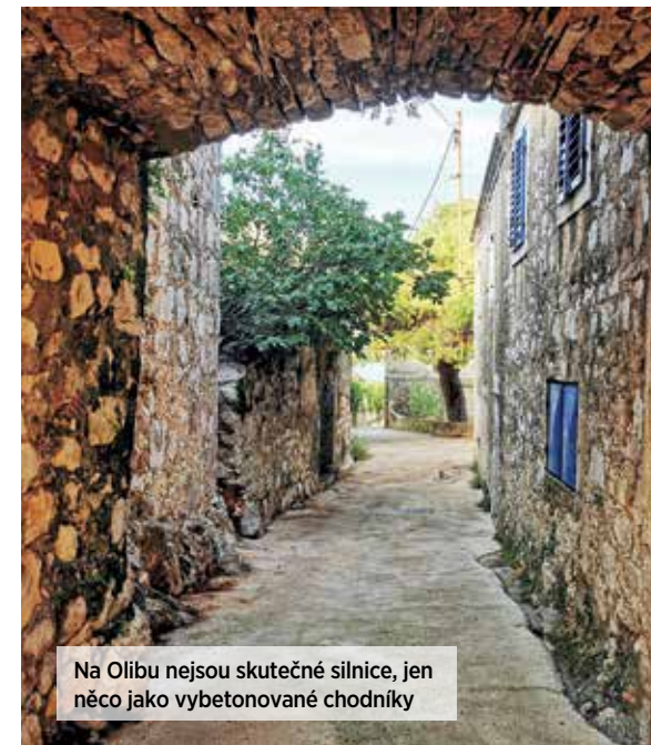
Na Olibu nejsou skutečné silnice, jen něco jako vybetonované chodníky

► Na Iži, kde nemá nejvyšší kopec ani dvě stě metrů a kde teplota koncem roku ani vzdáleně neklesá pod nulu, se překvapivě pořádají mezinárodní závody ve sjezdovém lyžování . Asi šedesát tun sněhu z pohoří Velebit na chorvatské pevnině nedaleko Zadaru přivezou nákladáky a vyklopí ho na mírně svažitou uličku v osadě Iž Veli. Závod Cena irské královny (Iškakraljica) se sedmdesáti metry každoročně svou svérázností přiláká lyžaře z několika zemí, včetně Rakouska a Švédska, a ožíví turistický ruch, který v zimě jinak pohasíná.