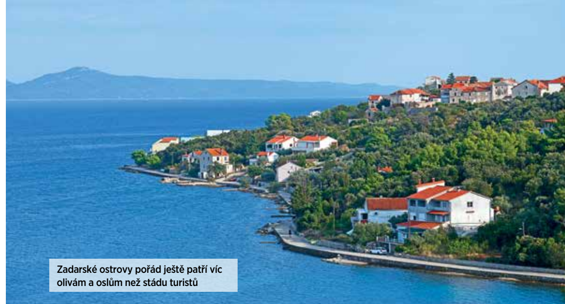
Zadarské ostrovy pořád ještě patří víc olivám a oslům než stádu turistů