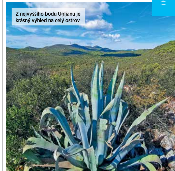
Z nejvyššího bodu Ugljanu je krásný výhled na celý ostrov

„vyrábějí“ dokonce i zdejší domácí kozy. Návštěvníci sem však jezdí spíše za proslulými bílými útesy Grpašćak, které trčí z vody do závratné výšky sto padesáti metrů, nebo za klidným slaným jezerem Mir, jehož voda je dokonce ještě slanější než ta v moři. ◀