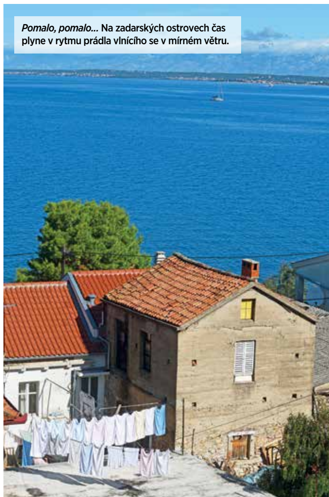
Pomalo, pomalo... Na zadarských ostrovech čas plyne v rytmu prádla vlnícího se v mírném větru.

Zdá se, že ty hluboké kořeny drží celý ostrov pohromadě a zároveň ho udržují v čase někde v minulém století. Celý okolní svět se mění, jen Olib zůstává