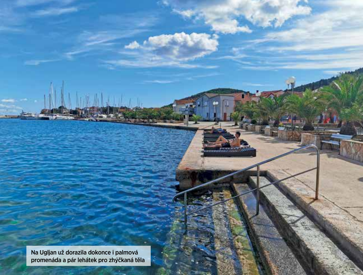
Na Ugljan už dorazila dokonce i palmová promenáda a pár lehátek pro zhyčkaná těla

a sardinek, které v chorvatských vodách uvíznou v sítích. Devět desetin z toho vyvezou do jiných zemí od Řecka po Španělsko.