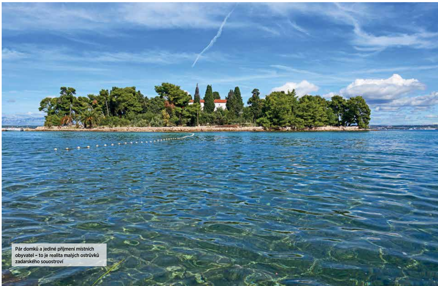
Pár domků a jediné příjmení místních obyvatel – to je realita malých ostrůvků zadarského souostrovi