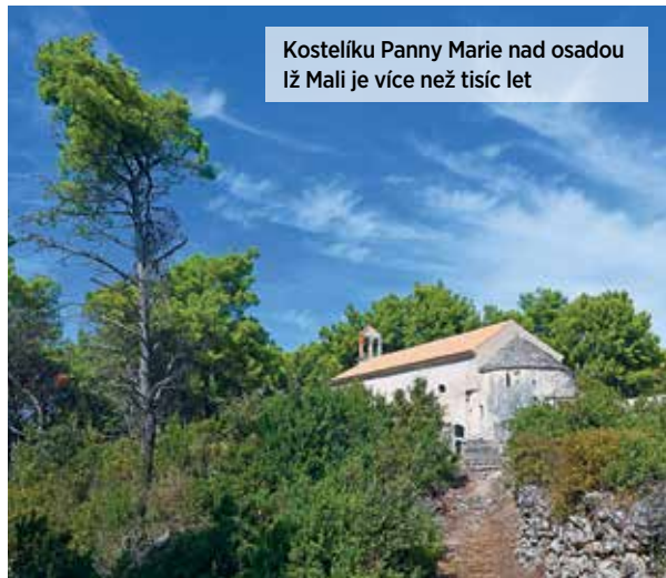
Kostelíku Panny Marie nad osadou Iž Mali je více než tisíc let

Kali znamená řecky dobře, neexistují však důkazy, že by byla nějaká souvislost mezi řečtinou a stejnojmennou vesnicí na ostrově Ugljan. Nejvíce ji proslavily zdejší sardinky. Obec s asi tisícovkou obyvatel dodnes platí za rybářskou velmoc Jadranu. Zdejší rybáři pochytají čtvrtinu všech sardelí