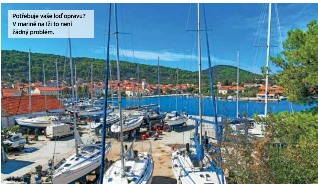
Potřebuje vaše loď opravu? V marině na lži to není žádný problém.

sice otřásají každý den a doslova mu tak „vydělají“ hrsti čtyřiceti kun, dlužno však říct, že ani „sretnomagareće govno“ úplně zadarmo není. Chce to především pečlivé přebírání nepřilíš vábně vonícího obsahu. Ono totiž není „govno“ jako „govno“. To vhodné k zasklení je tvořené stlačenými chuchvalci trávy, po vyprání nepáchne a technicky vzato to vlastně žádný běžný trus není.