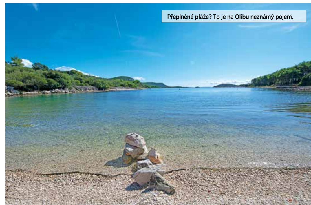
Přeplněné pláže? To je na Olibu neznámý pojem.