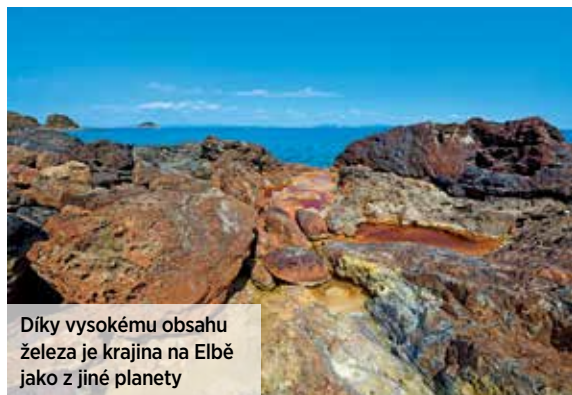
Díky vysokému obsahu železa je krajina na Elbě jako z jiné planety

Přístav Giglio Porto vítá návštěvníky pastelovými fasádami domů