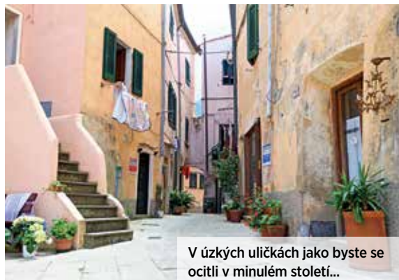
V úzkých uličkách jako byste se ocitli v minulém století...

Dva obsluhující v jediné místní restauraci, kuchař napůl skrytý v páře u sporáku v zadní místnosti, prodáváč v malém krámu se suvenýry nebo muž s koštětem zametající chodbu jediného „hotýlku“ s kapacitou deseti lůžek – ti