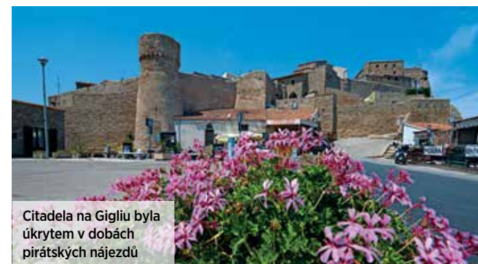
Citadela na Gigliu byla úkrytem v dobách pirátských nájezdů

Ještě před pár lety byl ostrov Giglio ne moc známým kouskem země se dvěma osadami a dvěma tisícovkami obyvatel. V lednu roku 2012 se ale u jeho břehů převrhla obří rekreační loď Costa Concordia . Při neštěstí zahynulo 32 lidí a dalších 64 bylo zraněno. Na záchraně cestujících se podílelo 2000 lidí. Někteří z nich navázali vztah s místními dívkami, které s nimi z ostrova odešly. Na Giglio se během té doby sjížděli „katastrofičtí turisté“, ostrov však má spoustu lákadel i bez vraku. Přístav nabízí obchůdky a taverny v domcích s barevnými fasádami a pozůstatky římské vily. Osada Giglio Castello je opevněnou citadelou s masivními hradbami a spleť úzkých uliček , do kterých se vmáčklo pár krámků a taven.