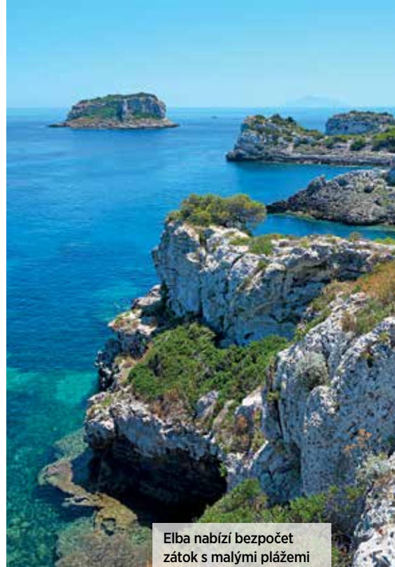
Elba nabízí bezpočet zátok s malými plážemi