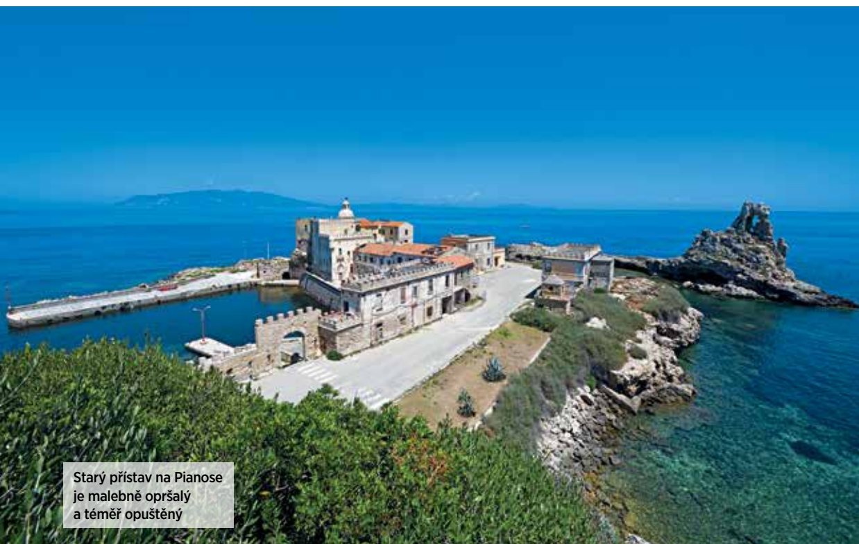
Starý přístav na Pianose je malebně opršalý a téměř opuštěný