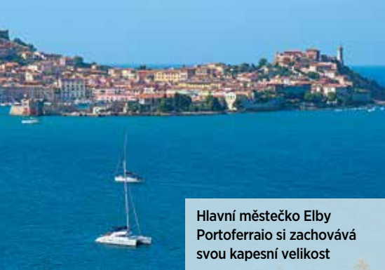
Hlavní městečko Elby Portoferraio si zachovává svou kapesní velikost