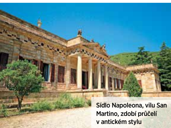
Sídlo Napoleona, vilu San Martino, zdobí průčelí v antickém stylu