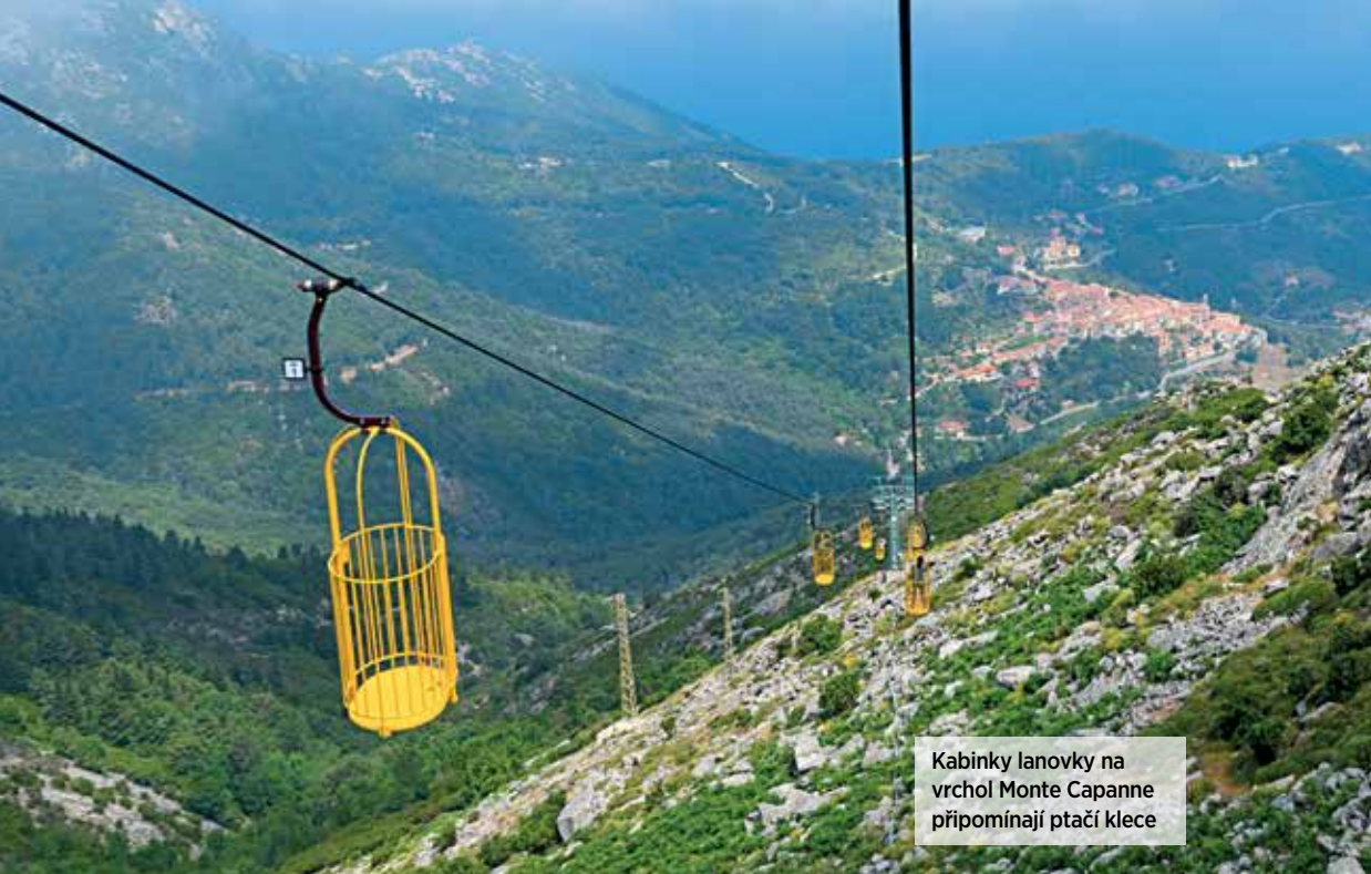
Kabinky lanovky na vrchol Monte Capanne připomínají ptačí klece

Byl to právě on, kdo zde zavedl povinnou školní docházku, založil policejní sbor, nařídil očkování dětí a v zájmu hygieny zakázal vyhazování odpadků z oken. Během necelých deseti měsíců exilu stihl Elbanům také navrhnout vlajku a sobě vybudovat dvě sídla. Ve vile San Martino v kopcích nad Portoferraiei trávil soukromé chvíle, zatímco v paláci Palazzina dei Mulini přímo ve městě přijímal návštěvy. Dnes může císařovy soukromé komnaty v obou budovách navštívit každý, koho zajímá historie.