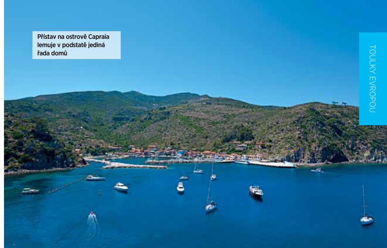
Přístav na ostrově Capraia lemuje v podstatě jediná řada domů

třeba náležitě chránit. Platí to i pro tyrkysové moře kolem, ve kterém se do vzdálenosti jedné míle od pobřeží nesmí rybařit ani kotvit. Pianosa je dnes zkrátka vězením, kam se každý rád vrací - a to včetně těch, kteří jsou tu skutečně za trest.