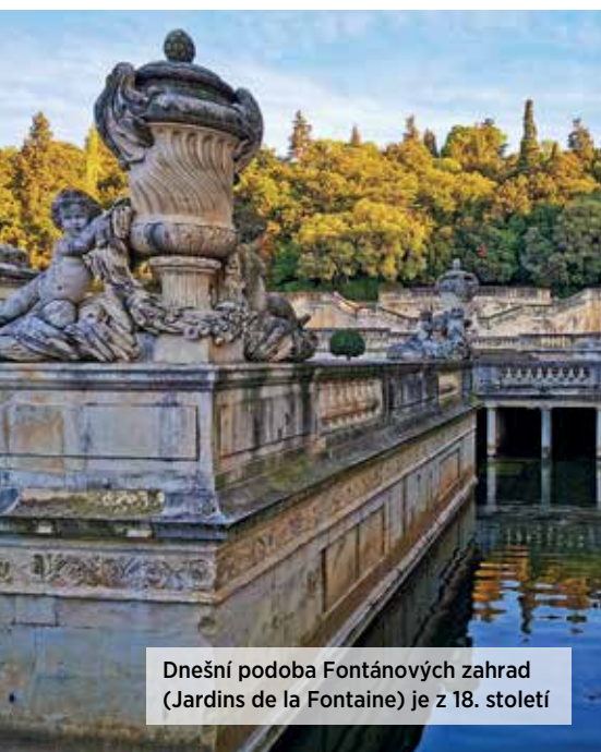
Dnešní podoba Fontánových zahrad (Jardins de la Fontaine) je z 18. století