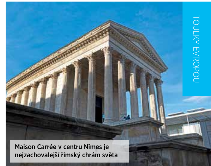
Maison Carrée v centru Nîmes je nejzachovalejší římský chrám světa

Francouzi jsou známí tím, že v duchu filozofie „la douce vie“ dokážou z každé situace vytěžit to příjemnější. V případě býčích zápasů se výsledek jmenuje „Course Camarguaise“. Při tomto klání krev neteče a největšími hvězdami jsou tu býci. Pozná se to mimo jiné i tak, že jejich jména září na plakátech mnohem větším písmem než jména zápasníků zvaných „rasetteurs“. Dobrý býk může zápasit téměř celé desetiletí a pak v klidu dožívá v nedozírné divočině camargueských plání. Rasetteutři oděni v bílých trikotech během souboje pouze