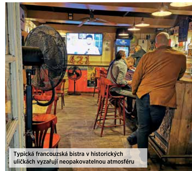
Typická francouzská bistra v historických uličkách vyznačují neopakovatelnou atmosférou