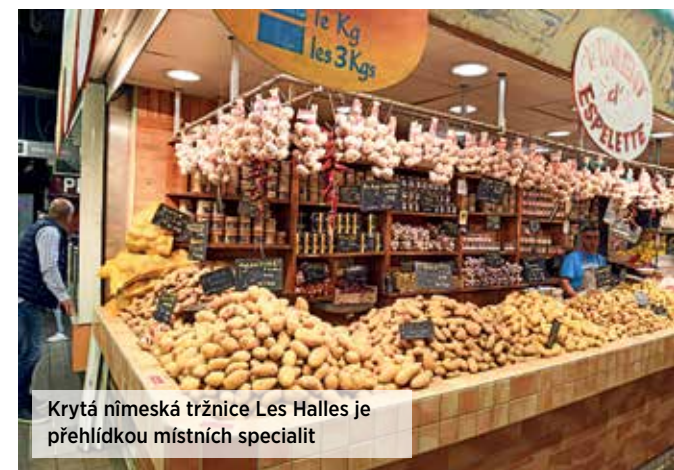
Krytá nîmeská tržnice Les Halles je přehlídkou místních specialit