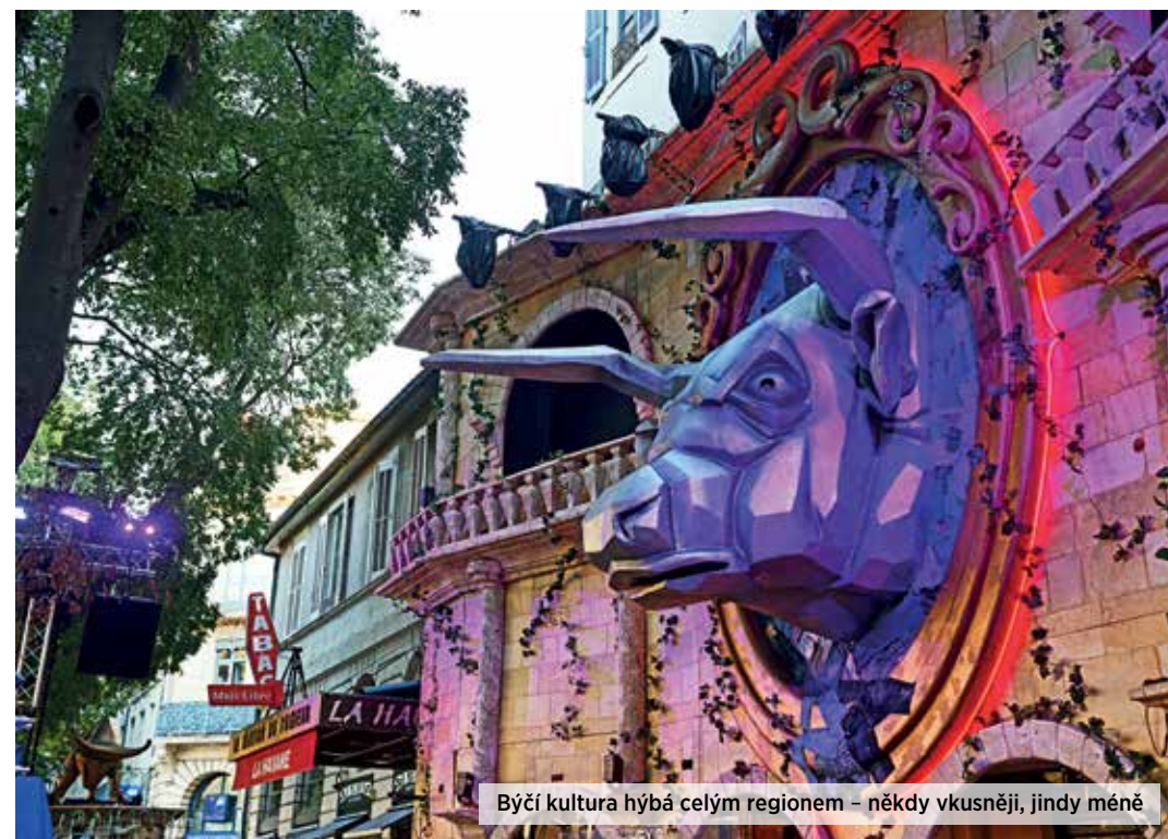
Býčí kultura hýbá celým regionem – někdy vkusněji, jindy méně