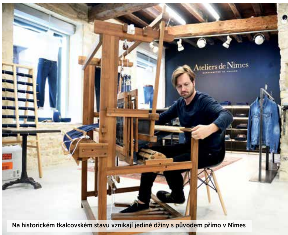
Na historickém tkalcovském stavu vznikají jediné džíny s původem přímo v Nîmes